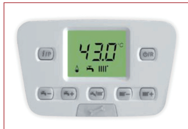
Tableau Initia Plus Compact HTE rétro-éclairé

Initia Plus HTE dispose d'un tableau de commandes convivial avec un écran indicateur rétro-éclairé. Boutons indépendants de réglage de la température de chauffage et ECS. Affichage par codes de toutes les informations et les paramètres de fonctionnement.