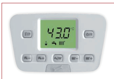
Tableau Initia Plus HTE rétro-éclairé

Initia Plus HTE dispose d'un tableau de commandes convivial avec un écran indicateur rétro-éclairé. Boutons indépendants de réglage de la température de chauffage et ECS. Affichage par codes de toutes les informations et les paramètres de fonctionnement.